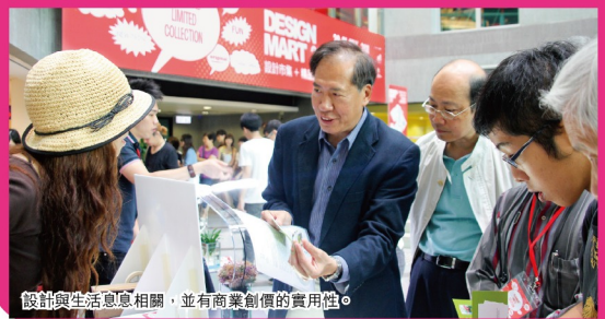
設計與生活息息相關，並有商業創價的實用性。

優質的創意設計，不但可創造商業價值，更可回饋社會，為社會上有需要的人提供自力更生的機會。如獲2011年亞洲最具影響力設計大獎社會So Soap，除了製作環保皂和回收膠樽循環再用外，更培訓低下階層成為肥皂師，為他們提供工作機會。又好像香港理工大學的教學研究酒店，除用作培訓修讀酒店學的學員外，亦憑著出色的設計，獲Trip Advisor旅遊網站選為2012年旅客之選獎中國25大最佳飯店之一，這些都是創新設計的實用例子。設計要「落地」，各方需要協力，讓市民大眾認識設計思維，設計與生活息息相關的重要性，透過不同層面的知識交流及知識產權保障，明白設計是推動社會創新及持續經濟發展的策略性工具。