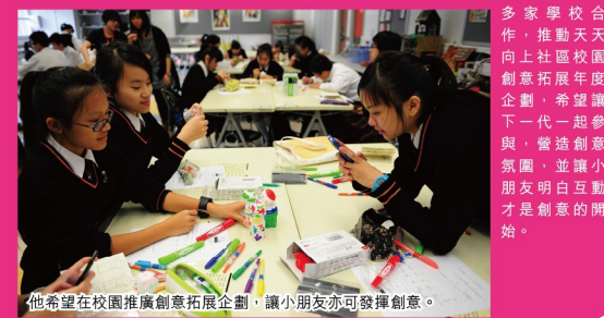
他希望在校園推廣創意拓展計劃，讓小朋友亦可發揮創意。

香港可從人口、教育、土地、技術轉移、城市規劃、人力資源及領袖培訓等政策上去改變，特別培育具批判性思考的領導人才，去領導業界發展。他並指除政府外，大學研究部門、政黨和非常利團體於推廣創意產業發展亦擔當十分重要的角色。而為促進業界交流，他除積極與各地業界人士商討亞洲創意網絡的發展，實行與各地通力合作，亦藉著其中一件「天南星」作品，讓不同設計者發揮創意，借此推廣開放、互動及平等參與的香港創意精神，並藉不同作品，啟發大家的創作靈感。他並與20